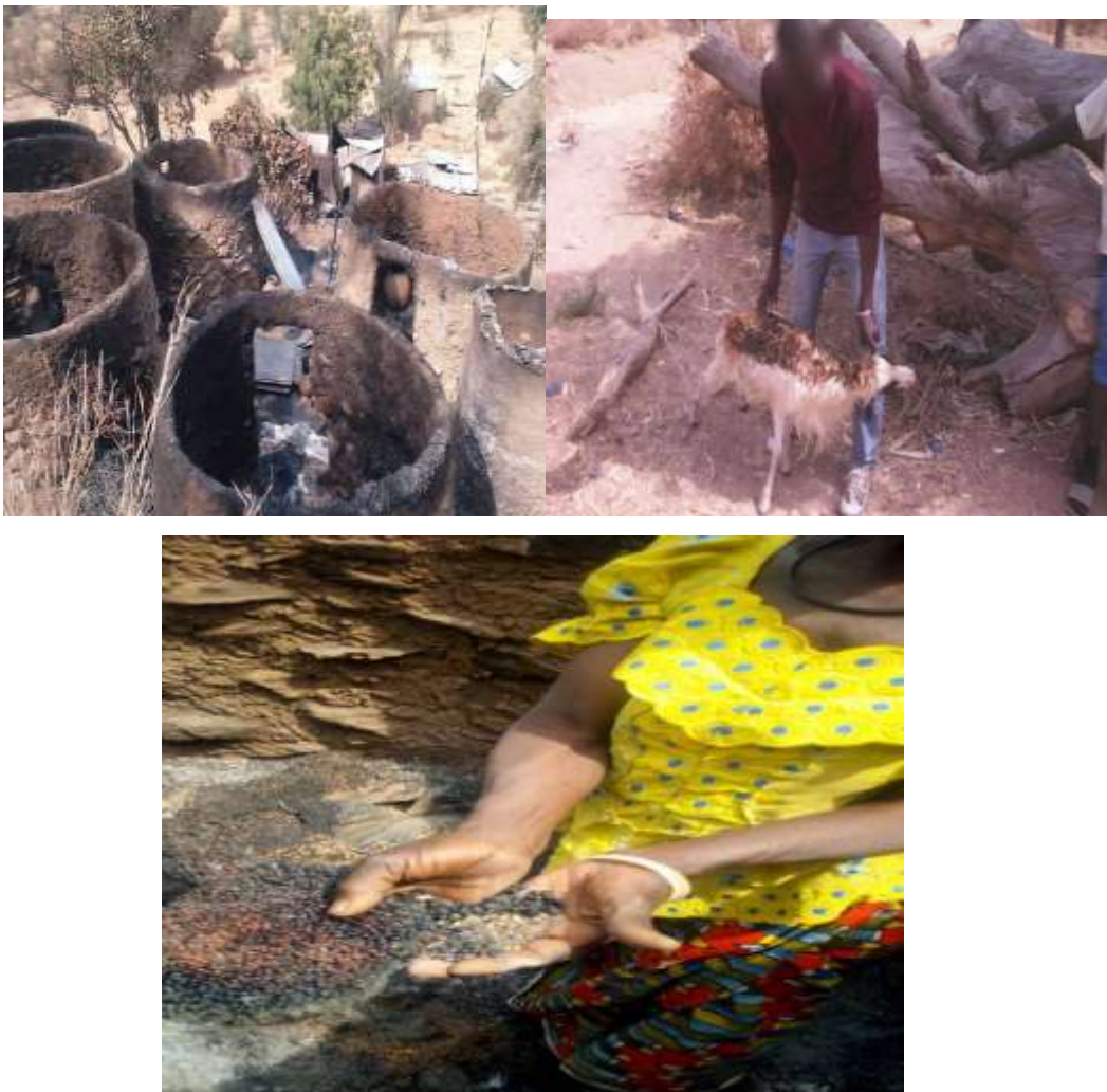
Planche 1 : Greniers, céréales et moutons incendiés par les Boko Haram à zelevet