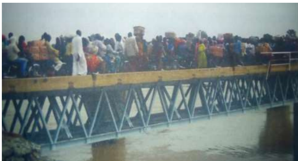
Photo 1 : Crises tchadiennes et arrivée massive des migrants à l'Extrême-Nord du Cameroun.