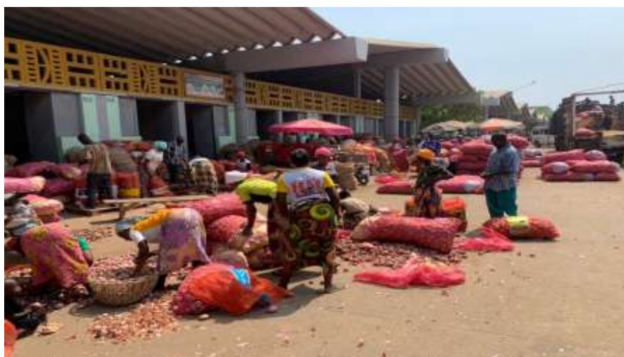
Photo 1 : Des mouvements montrant la traite de la filière d'oignon